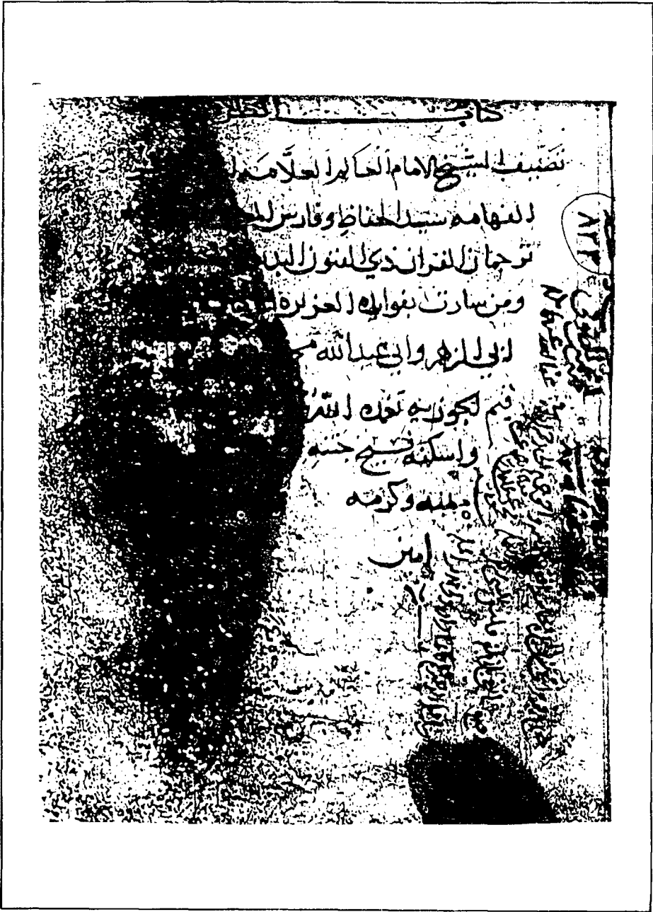
صفحة العنوان من نسخة تشستر بيتي (د)