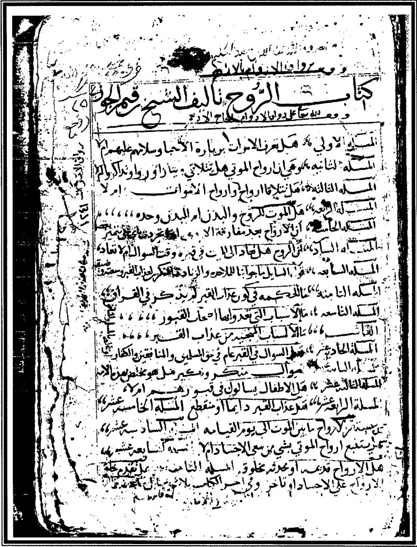
صفحة العنوان من نسخة المكتبة الأزهرية (ز)