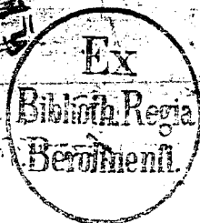
٢ - صورة الغلاف من نسخة «برلين» الألمانية (ب)